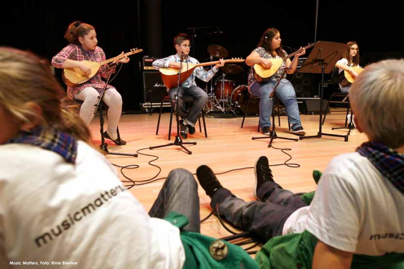
Music Matters

Music Matters (MM) is een stadsbreed programma dat tot doel heeft kinderen en jongeren in hun vrije tijd actief in aanraking te brengen met muziek. Voor de organisatie hiervan is in 2007 een stichting opgericht die door middel van muziek de sociale en culturele participatie van kinderen en jongeren in Rotterdam wil vergroten. Zij is op dit moment (mede)financier van een aantal projecten zoals de Brassbandschool en de wijkorkesten- en koren. Music Matters is samen met de verschillende partners verantwoordelijk voor de ontwikkeling van nieuwe concepten en uitbouw van succesformules. De ontwikkelde concepten zijn erop gericht dat ze een eigen plek binnen de bestaande infrastructuur veroveren. Website: www.musicmatters.nu .